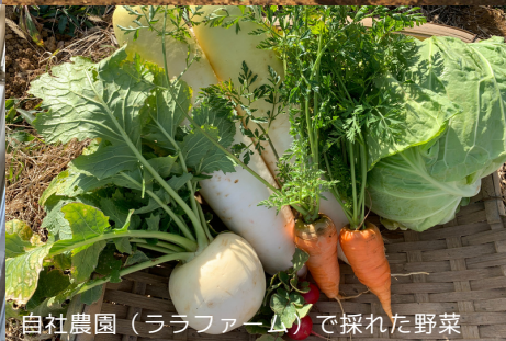
自社農園（ララファーム）で採れた野菜